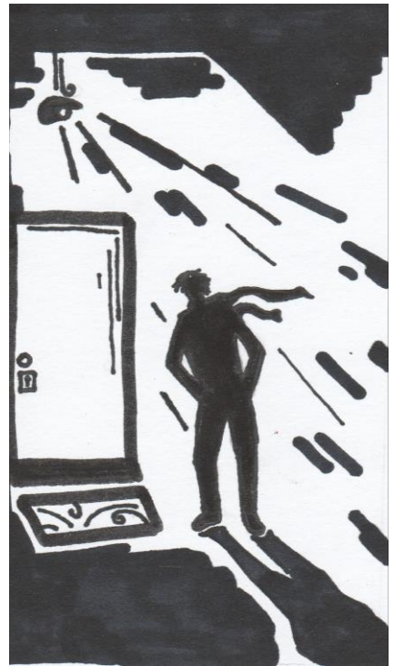
Рис. К «Битый час у порога топчусь...» Худ. ДАНИИЛ ТЕСТОВ