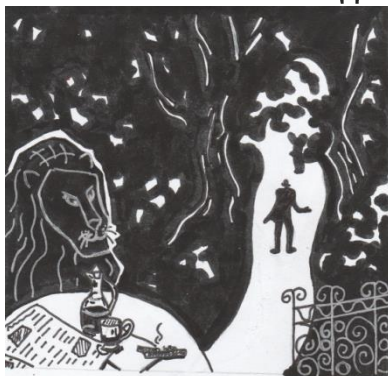
Рис. к стиху.